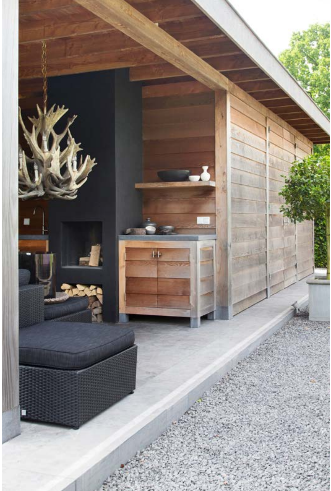
Het outdoorsalon is van PR & Design, de opvallende lamp (via Gert Snel) is gemaakt van kunststof.